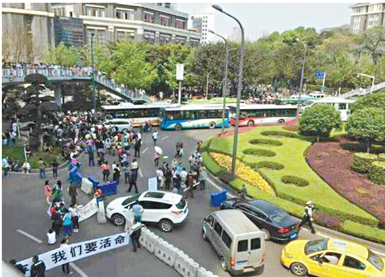
重慶數百名尿毒症患者及其家屬抗議看病費用上漲