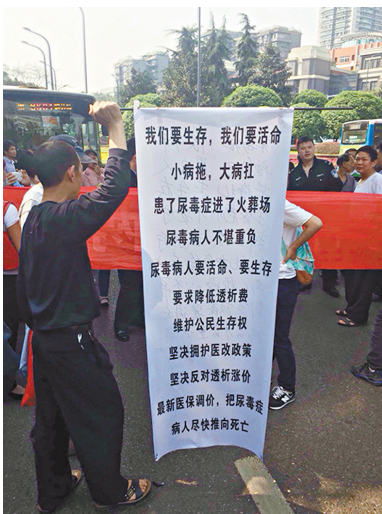
尿毒症患者及其家屬抗議看病費用上漲