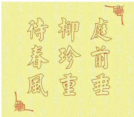
《九九消寒图》(文字版)