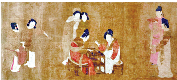
宋人描绘《唐双陆仕女图》

《九九消寒图》既能记事,又能陶冶女孩子的性情,是一种很有文化的冬日小游戏。不过,更为大众化的娱乐活动则是“博戏”。所谓“博戏”,说白了就是打牌掷骰赌输赢,角胜负。但与男性重“博”不同,女性更青睐“戏”,看重其独特的趣味性。