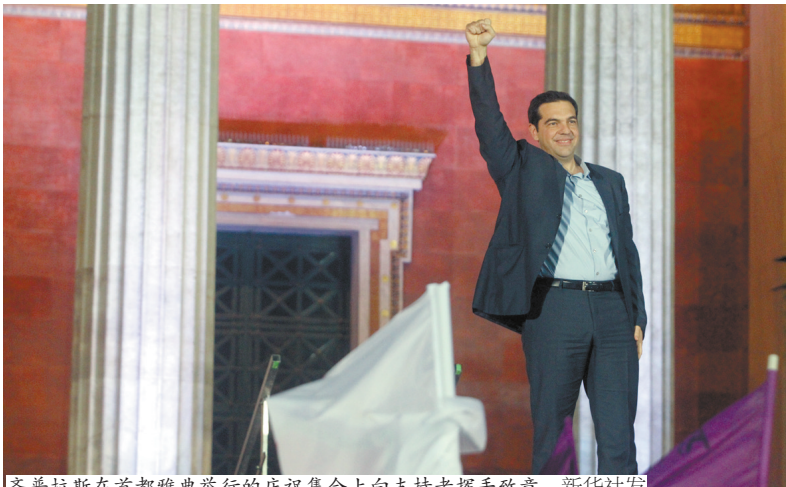
齐普拉斯在首都雅典举行的庆祝集会上向支持者挥手致意。

该党反对紧缩财政措施和现有的救助计划，领导人齐普拉斯表示，希腊不会与债权人发生冲突，不会破产，也不会退出欧元区