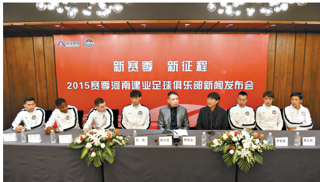
1月21日,2015赛季河南建业足球俱乐部新闻发布会现场。当日,2015赛季河南建业足球俱乐部新闻发布会在郑州举行。河南建业足球俱乐部总经理陈礼安、主教练贾秀全宣布引入7名新援。

哈维尔·帕蒂诺,司职前锋,1988年2月出生,具有西班牙和菲律宾双重国籍,2014泰国联赛最佳射手。从小在西班牙踢球,禁区内转身灵活,射门技术高超,身体强壮,对抗能力极强。(新体)