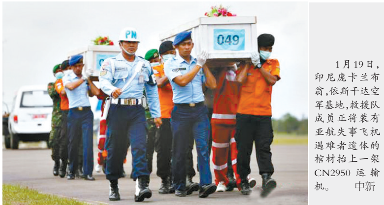
1月19日,印尼鹿卡兰布翁,依斯干达空军基地,救援队成员正将装有亚航失事飞机遇难者遗体的棺材抬上一架CN2950运输机。中新

载有162人的印尼亚航QZ8501去年12月28日从印尼泗水起飞约40分钟后坠毁。客机出事前,机师曾以“天气恶劣”为由要求爬升,但因该空域当时拥挤而不获批准,几分钟后客机就与控制塔失联,期间机师没发出求救信号。(中新 新华)