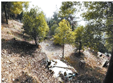
旺山公墓院内，季建业购买的公墓用地。