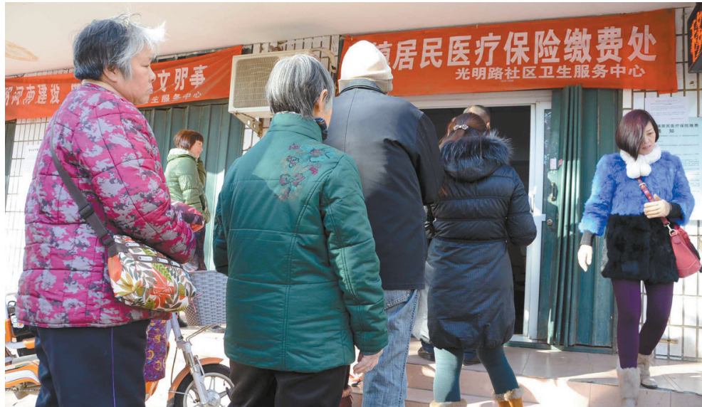
2014年12月4日, 光明路与建设路交叉口西侧的社区卫生服务中心门前, 居民在排队缴纳城镇居民医疗保险。

去年12月16日上午, 记者在市爱心救助超市碰到了前来领取救助物品的湛河区高阳路街道辖区低保