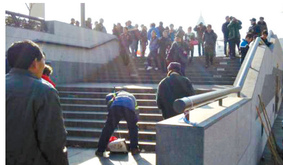
事故现场,通往外滩观景平台的台阶