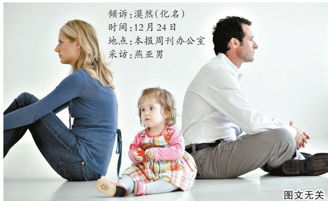
倾诉:漠然(化名) 时间:12月24日 地点:本报周刊办公室 采访:燕亚男