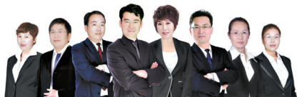
平顶山医美中韩专家团

平顶山医美整形坚信每个女人心里都有一个更完美的自己,或许您只要改变一点点,就能为自己插上美丽的翅膀,拥抱更美好的未来。2015年新年来临之际,平顶山医美特推出“年末巨惠 焕新颜迎新年”活动,为渴望拥有青春、追求完美的女人提供一次实现变年轻的机会,一场鹰城整形风暴即将来袭。