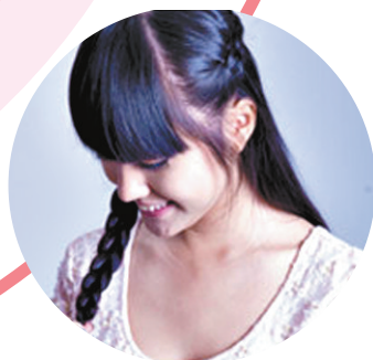
Step5:用橡皮筋固定发尾。