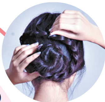
Step7:再将发辫沿着花苞头缠绕成一个发圈后固定即可。