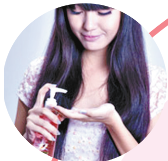
Step1:先在头发上喷上定型水