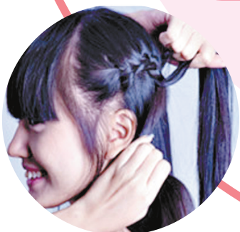
Step3:不断并入后方的头发编织。