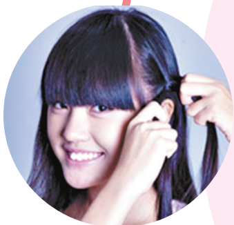
Step2:沿着刘海取出一束头发编成辫子。