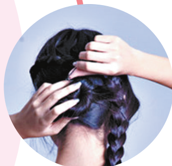
Step6:取出左侧剩余的头发缠绕成花苞头。

前两天的风给鹰城女性的发型带来了毁灭性的打击,以往飘逸黑亮的直发、温婉大方的卷发均被肆虐的大风吹成了“梅超风”。只要掌握了扎发技巧瞬间就能打造出防风的优雅造型,今天教大家一分钟梳出防风优雅造型,既能防风又能让你秒杀眼球甜美吸睛。