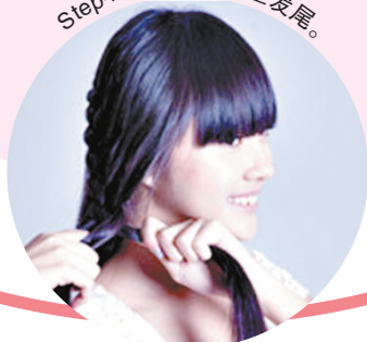
Step4:一直编织直至发尾。