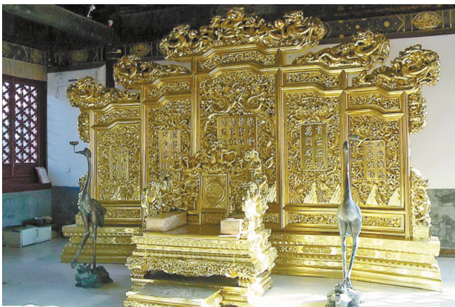
嵩祝名院所在的嵩祝寺及智珠寺内,一处被用作餐厅的古建筑内,摆放着一张“龙椅”。

2014年11月1日,住建部等十部委出台了《关于严禁在历史建筑、公园等公共资源中设立私人会所的暂行规定》并已开始施行。但记者近日调查发现,该项规定出台后,位于北京市中心故宫附近的嵩祝寺及智珠寺,作为北京市文物保护单位,仍然内设豪华餐饮、住宿服务,部分区域甚至成为只对少部分人开放,可以烧香、“坐龙椅”的私人化高档消费场所。