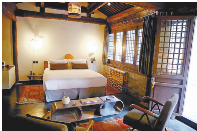
嵩祝寺及智珠寺内,一些古建筑被改为客房,价格为每天2000元到4500元。