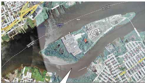
图为委内瑞拉前总统查韦斯送给美国的“佩蒂岛”。(资料)

华春莹还介绍了委内瑞拉部长会议副主席兼财政部长托雷斯访华的情况。华春莹说,托雷斯于2日来华访问,中方有关部门和金融机构负责人同他就中委务实合作交换了看法。