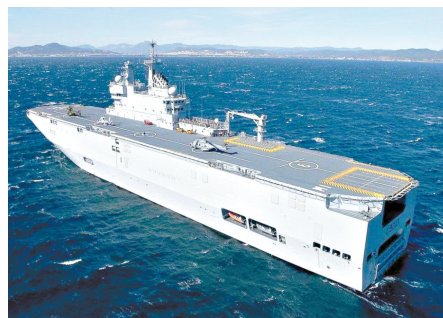
法国“西北风级”两栖登陆舰资料图