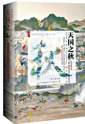
《天国之秋》作者:裴士锋 社会科学文献出版社

耶路撒冷是两个国家的首都,三种宗教的圣地,是当今文明冲突的战场。如此狭小偏僻的城镇为何会成为当今中东和平的关键?西蒙·蒙蒂菲奥里依年代顺序,以三大宗教围绕“圣城”的角逐,以几大家族的兴衰更迭为主线,透过耶路撒冷的男男女女——国王、皇后、先知、诗人、圣贤、征服者和妓女所带来的启示,呈现耶路撒冷的传奇。值得称道的是,为这样一座拥有三千年历史的城市撰写编年史,作者却能写得如惊悚片一样扣人心弦。