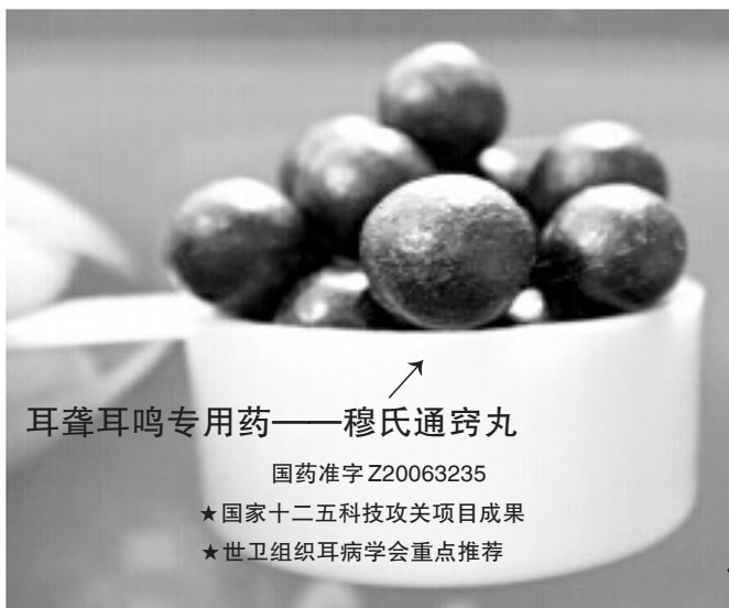
耳聋耳鸣专用药——穆氏通窍丸