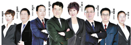
平顶山医美整形中韩专家团队

随着生活水平的提高,越来越多的爱美人士加入了整形大军。在平顶山,做整形的爱美人士大部分选择在医美实现美丽蜕变的愿望。为什么大多数爱美人士选择平顶山医美整形呢?让我们一起来看看: