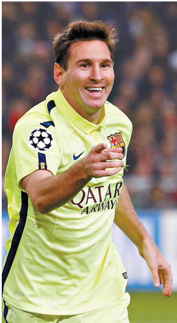
11月5日,巴塞罗那队球员梅西在比赛中庆祝进球。