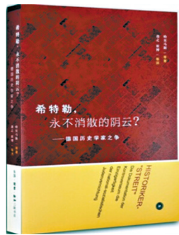
学术《希特勒，永不消散的阴云? 德国历史学家之争》作者：哈贝马斯等 译者：逢之 崔博等 三联书店

上世纪80年代，在当时的联邦德国发生了一场著名的争论，后来被称为“德国历史学家之争”。争论围绕纳粹罪行的独特性、如何评价第三帝国在德国历史中的地位和作用、如何评价和书写历史等问题展开。虽然这场争论没有明确的最终结论，但提出的问题是整个德国社会二战以后虽未明言却普遍关心的，对整个社会开放数十年以来的思想禁区，加深关于德意志第三帝国历史的思考有很大的推进作用。