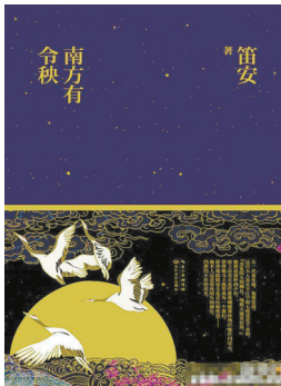
小说《南方有令秧》作者：笛安 长江文艺出版社

上世纪80年代，在当时的联邦德国发生了一场著名的争论，后来被称为“德国历史学家之争”。争论围绕纳粹罪行的独特性、如何评价第三帝国在德国历史中的地位和作用、如何评价和书写历史等问题展开。虽然这场争论没有明确的最终结论，但提出的问题是整个德国社会二战以后虽未明言却普遍关心的，对整个社会开放数十年以来的思想禁区，加深关于德意志第三帝国历史的思考有很大的推进作用。