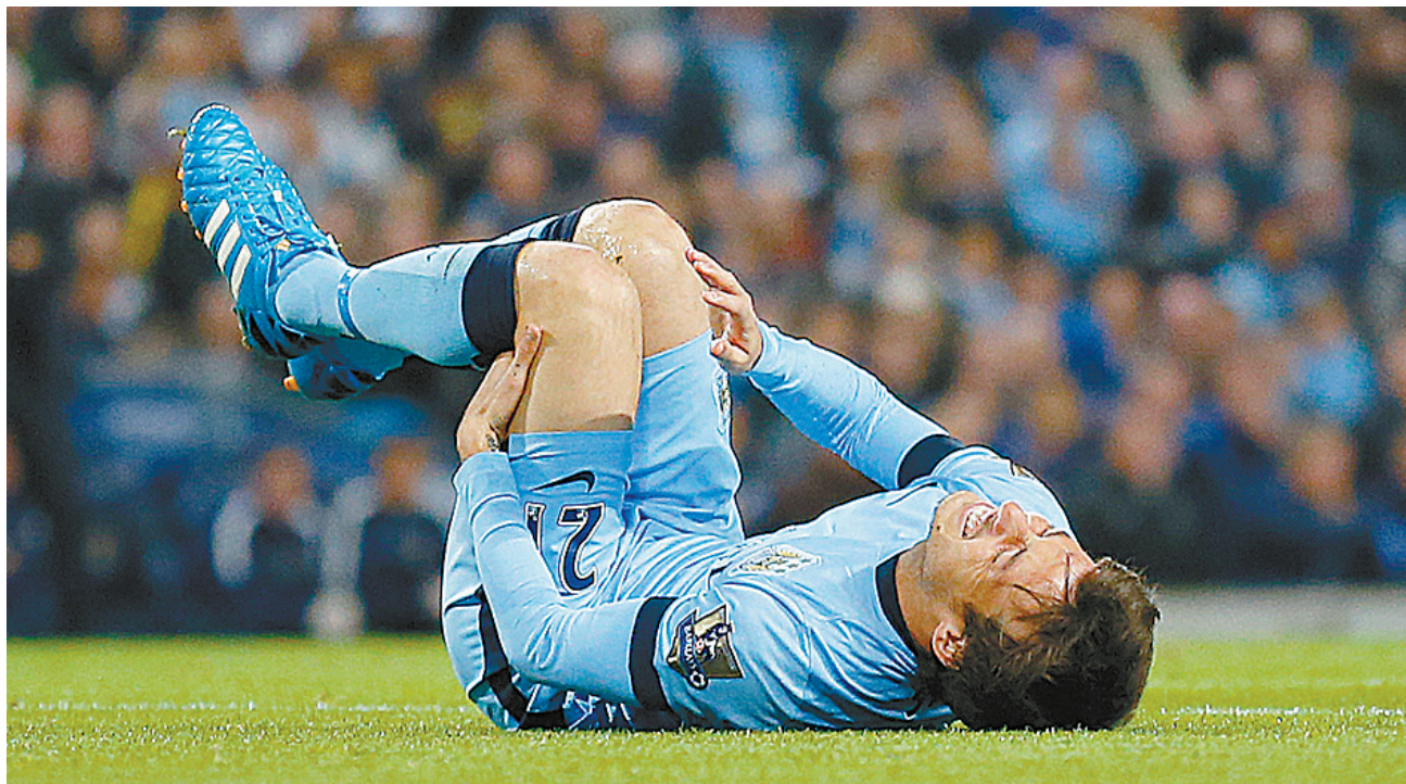
昨晨,曼城队球员席尔瓦在比赛中受伤倒地。

本报讯 曼城持续低迷,昨晨在英格兰联赛杯第4轮主场0:2不敌纽卡斯尔,惨遭两连败,无缘八强。纽卡斯尔则迎来三连胜,反弹之势强劲。