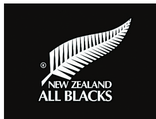
图为新西兰国家橄榄球队“全黑队”队旗。