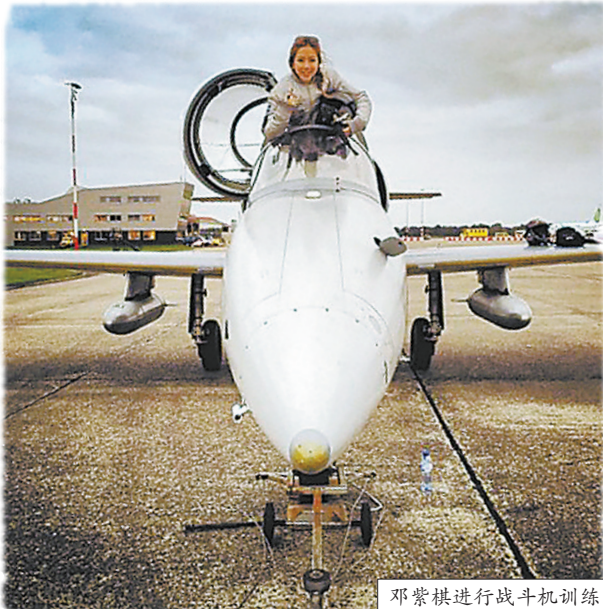
邓紫棋进行战斗机训练

关于在103km的高度能看到什么美景?有专业人士是这样描述的:只有在外太空才能看到