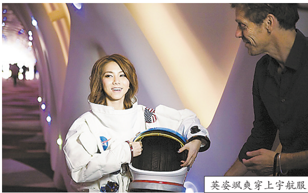
英姿飒爽穿上宇航服