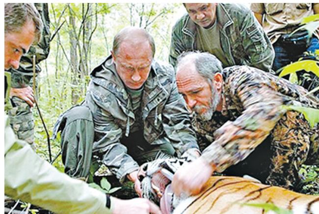
今年5月放生“库贾”前,普京亲手为它戴上卫星追踪项圈。

本报讯 据俄罗斯之声报道,最新跟踪信息显示,由俄罗斯总统普京今年5月在阿穆尔州放生的东北虎“库贾”穿越国境进入中国后继续往南走,已离俄罗斯越来越远,有可能在中国境内过冬。