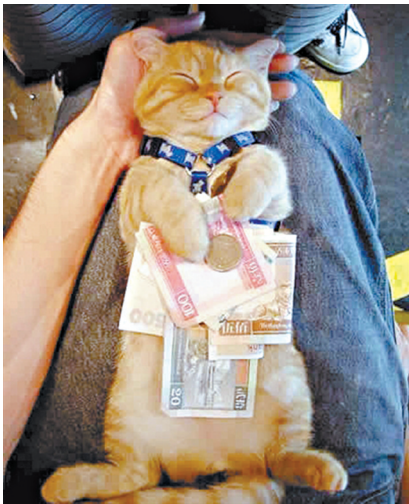
老有钱了