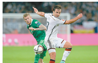
格策(右)在比赛中拼抢。