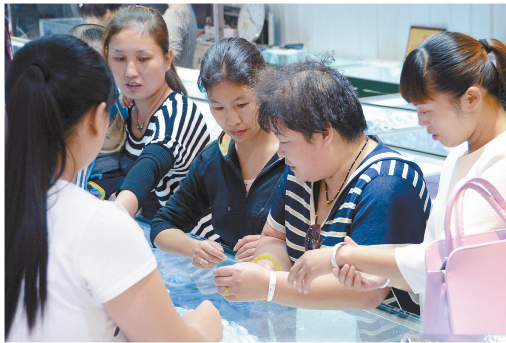
金银饰品降价,引来不少市民选购。

记者采访中了解到,同样是足金,一些知名度较高的个别品牌每克价格仍在300元以上。“同样是足金,但不同品牌的做工、成色、售后