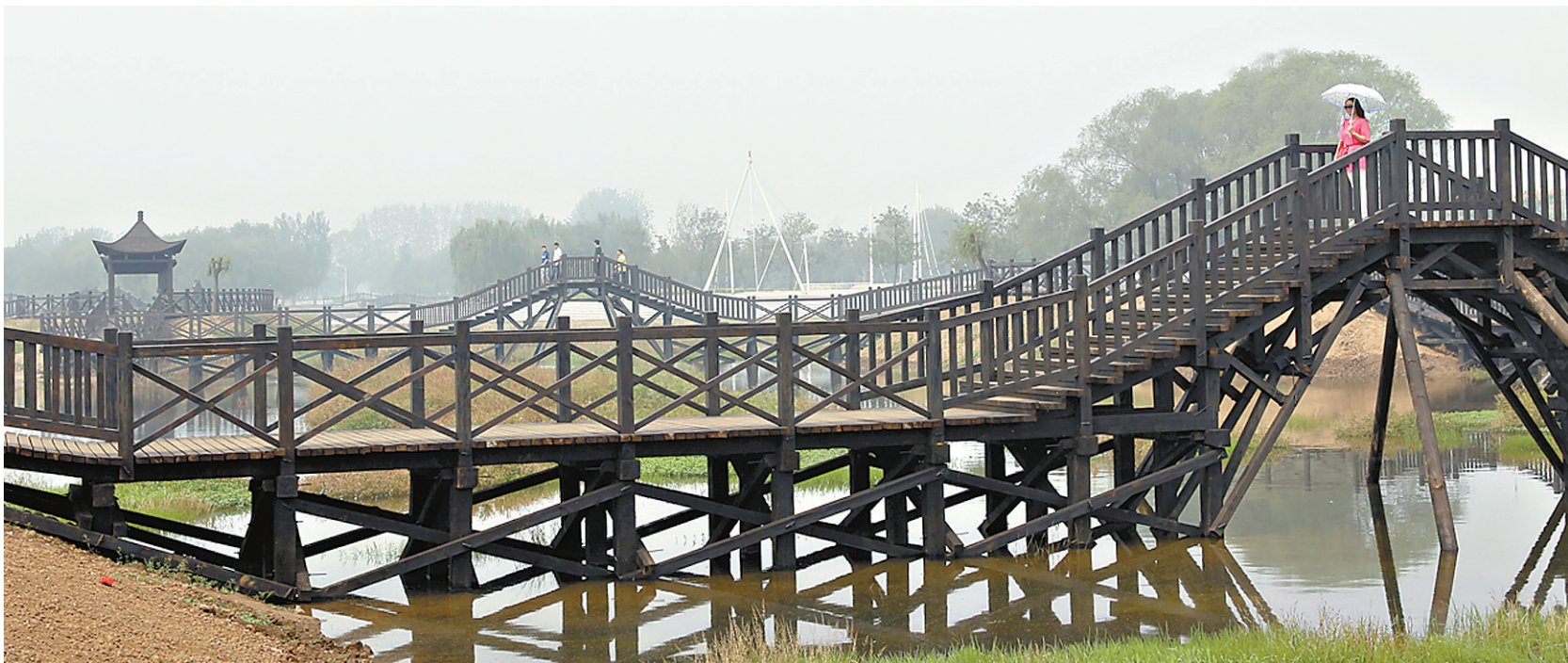
白龟湖畔栈道景观