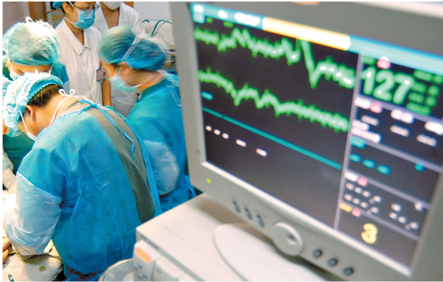
9月27日,在市区一家医院,医生为一位心脏病患者进行手术。

据悉,主动脉夹层是由于主动脉血管内膜局部撕裂,受到血液冲击,主动脉内膜剥离形成真假两腔,从而导致一系列撕裂样疼痛。主动脉一旦出现在内膜层撕裂,不进行及时治疗,死亡率会非常高。相关数据显示,临床上80%以上的主动脉夹层患者有高血压病史,特别是中老年人,更易导致主动脉夹层。“但没有高血压史的人士也不要掉以轻心,因运动量过大、生气暴怒等因素造成的一时血压升高也可能