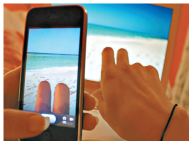
沙滩热腿照可以这样搞定