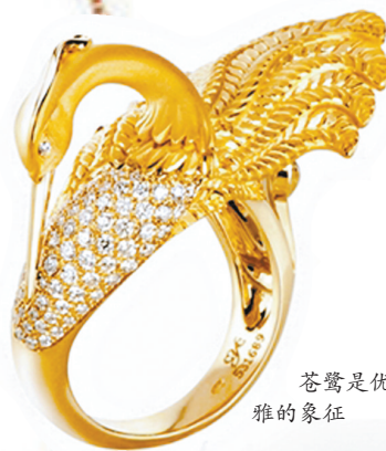
苍鹭是优雅的象征

该女士高级珠宝系列的设计灵感来源于交织的花瓣——精致而感性的玫瑰花瓣图案,其天鹅绒般的丝滑质感象征着女性娇媚温柔的性格特质。数枚花瓣交织在一起的独特设计风格,在赋予女性优雅魅力的同时,又展现了当代珠宝首饰的细致精工。