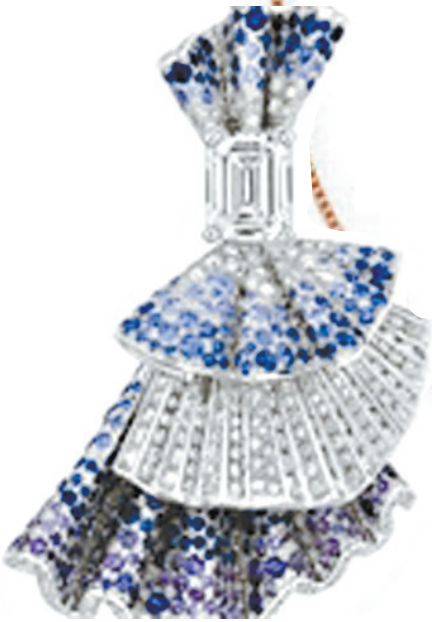
Archi Dior 系列