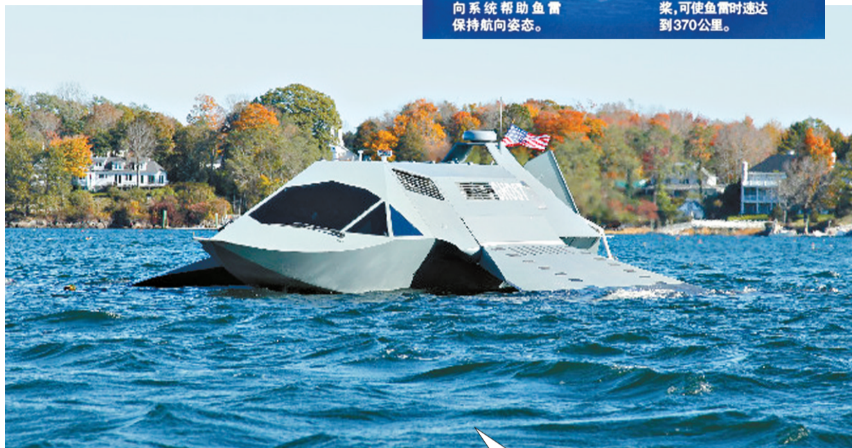
美国朱丽叶海洋系统公司开发的高速船舶“幽灵”号,航速最高可达50节

正因速度快、动能惊人,超空泡鱼雷还具有威力大的特点。这种鱼雷仅凭撞击能量,也能给目标造成严重伤害,如果再携带高效能的爆破弹头或核弹头,任何舰艇都难防范。