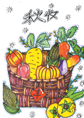
秋收 联盟路小学教育集团 四(5)班 胡雨晗