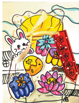
中秋 胜利街小学教育集团 二(5)班 靖嘉琪