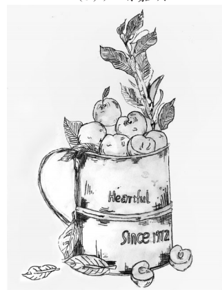
水果蛋糕 开源路小学六(6)班 石知秋 指导老师:张鸽