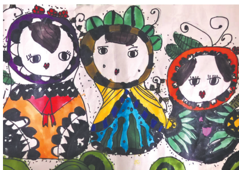
◀俄罗斯套娃 光明路小学教育集团 三(6)班 张文彦