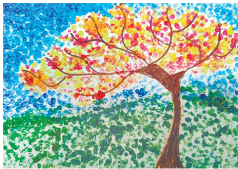
▶秋 联盟路小学教育集团 三(3)班 鲁俊杰