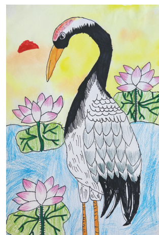
大自然的精灵丹顶鹤 东风路小学四(1)班 刘子诺