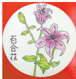
百合花 开源路小学二(7)班 游博雯 指导老师:黄晓亚