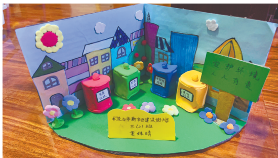
垃圾分类 建设街小学三(2)班 黄姝晴