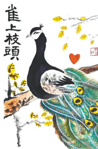
雀上枝头 光明路小学教育集团三(1)班 郑果