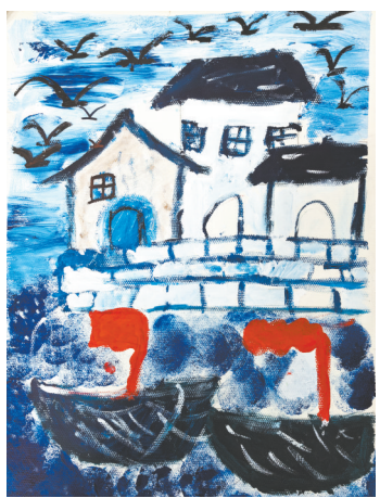
江南水乡 福佑路小学二(4)班 陈馨悦 指导老师:杨超楠