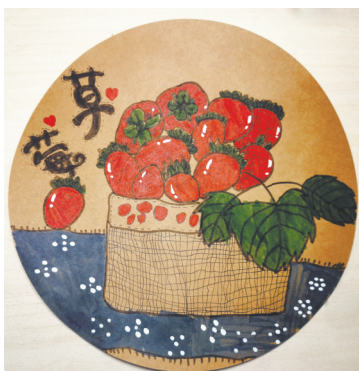
草莓 雷锋小学教育 集团三(1)班 赵凡睿