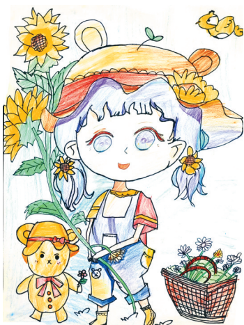
可爱的女孩 公明路小学三(1)班 王奕媵 指导老师:贾培培