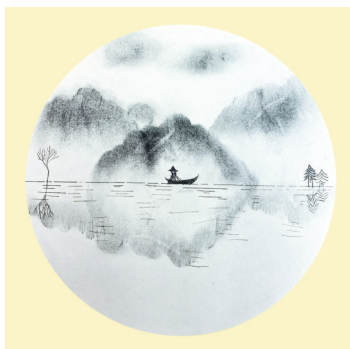
山水如画 雷锋小学教育集团四(3)班 薛明