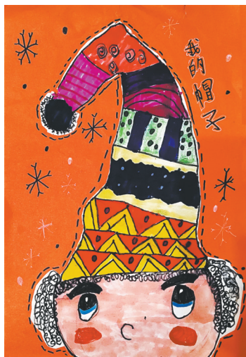
帽子 福佑路小学三(2)班 陈昊宇