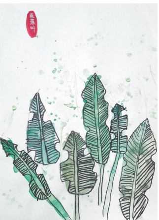
芭蕉新绿 新华区实验小学二(4)班 马婉琳 指导老师:赵珂漫