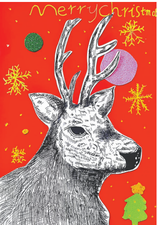
可爱的麋鹿 公明路小学四(2)班 张梦好 指导老师:刘闪闪