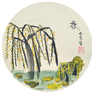
垂柳 翠林蓝湾小学三(2)班 李莞馨 指导老师:赵娟娟