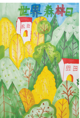
一起“森”呼吸 福佑路小学三(2)班 樊懿萱