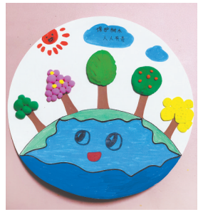
保护树木 人人有责 新华区实验小学二(4)班 金宸羽 指导老师:赵珂漫