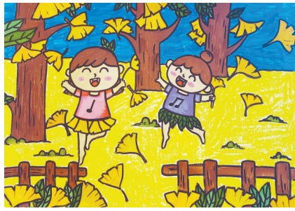
秋天的舞蹈 福佑路小学一(2)班 王茗洋