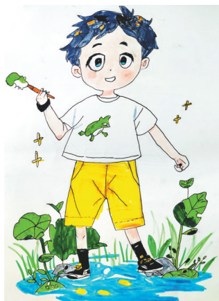
阳光男孩 雷锋小学教育集团五(3)班 高尔迪 指导老师：海霞