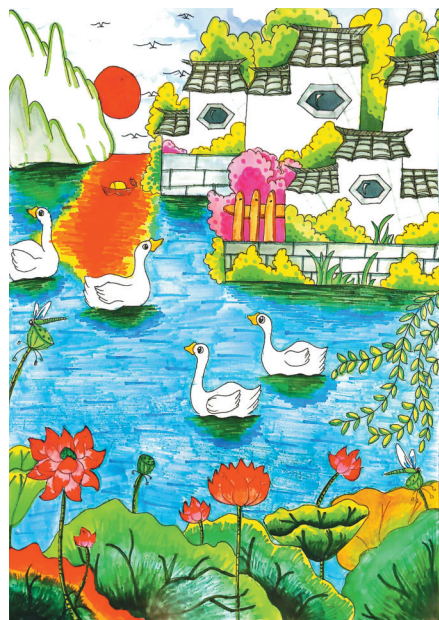
公明路小学五(1)班 胡雅涵 夕阳晚照