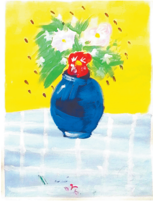
花 福佑路小学四(2)班 郭紫枫