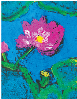
夏日荷花 福佑路小学二(4)班 李昭凝 指导老师：杨超楠