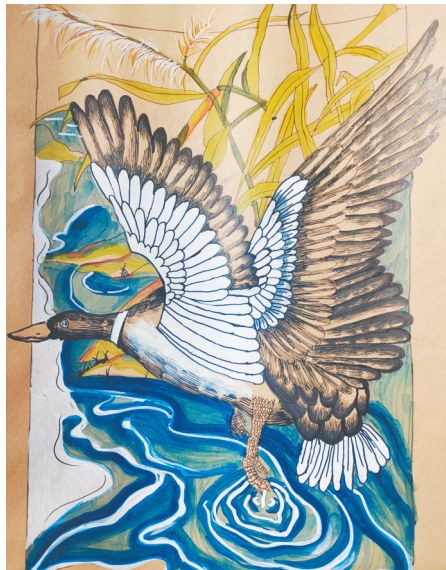
雷锋小学教育集团四(1)班 赵静莹 起飞