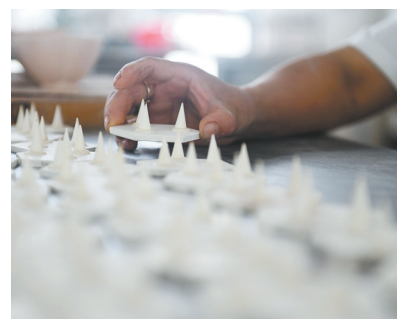
员工在制作支钉盘