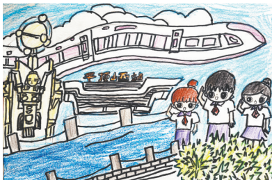
我的家乡 建设路校区二(13)班 王依苒