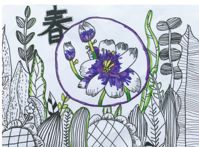
春 建设路校区一(6)班 臧子桦