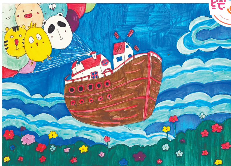
飞船环游 建设路校区二(10)班 刘格熙真 (指导老师:刘伽椰)