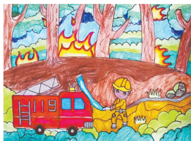
安全教育 建设路校区一(3)班 武浩祥 (指导老师:李洋)