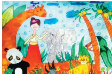
动物世界 建东校区四(4)班 刘铭皓