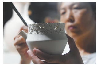
员工在整理汝瓷素坯