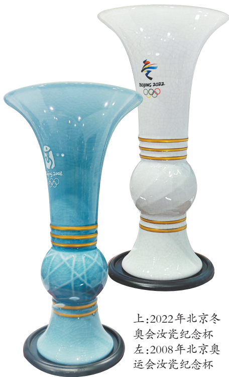
上：2022年北京冬奥会汝瓷纪念杯 左：2008年北京奥运会汝瓷纪念杯