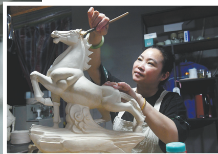
员工对汝瓷素坯进行雕花