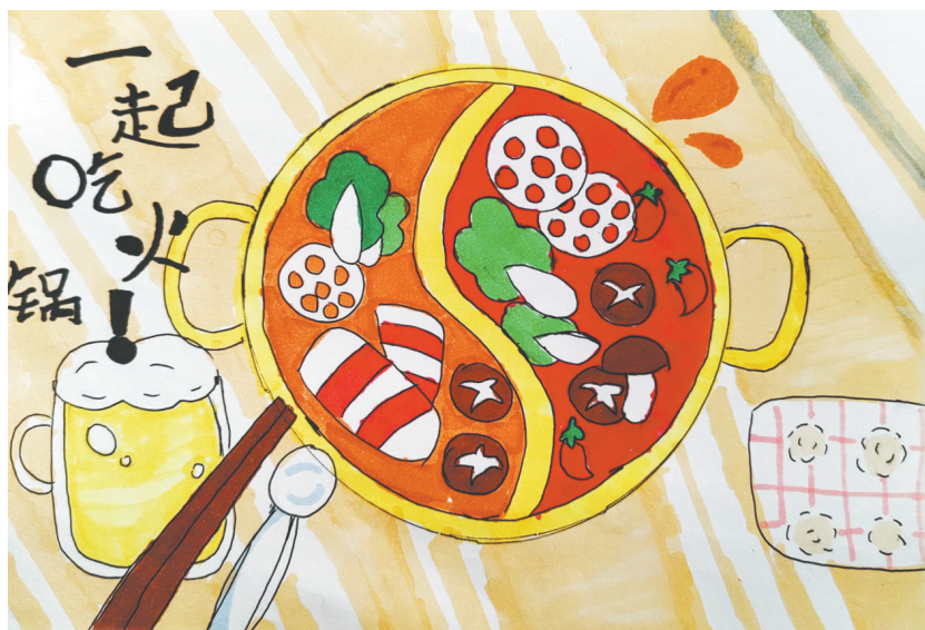
吃火锅 新新街小学二(1)班 侯逸馨