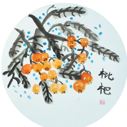
枇杷 雷锋小学教育集团三(4)班 付祿语