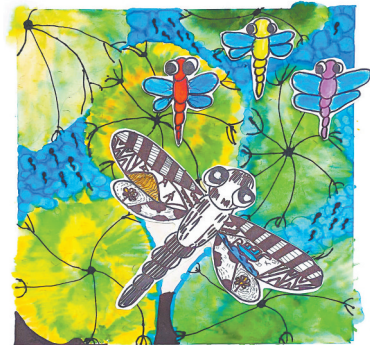
蜻蜓爸爸携子出游记