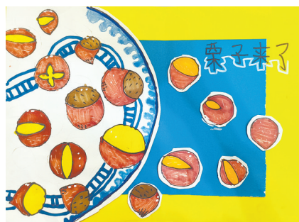
栗子来了 一(2)班 岳欣冉