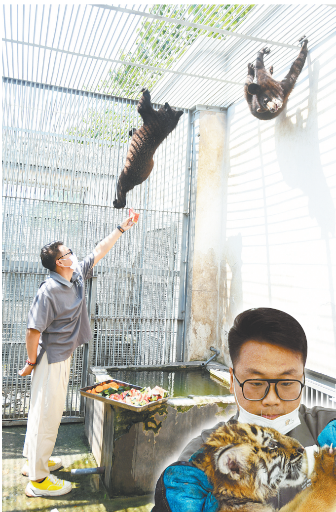
▲饲养员给两只小熊送来一大盘水果