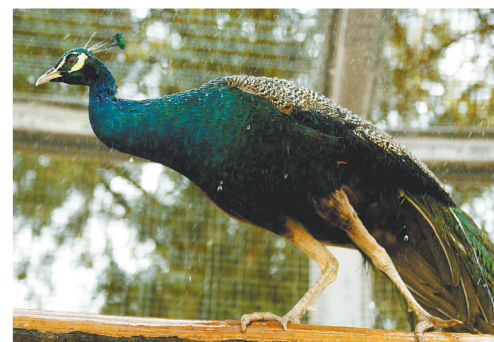
▲孔雀在细腻的水雾中漫步

泽把水果放在地上离开,它们三两下窜到地面大快朵颐,其中一只还用爪子捧着水果,憨态可掬。