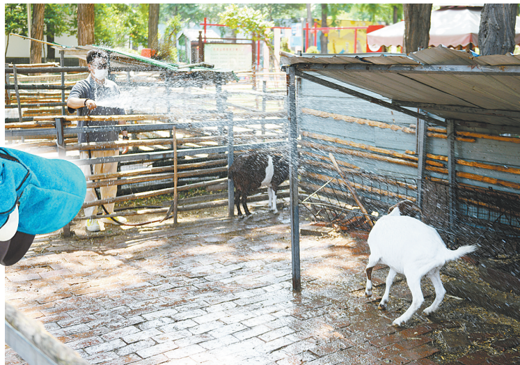
▲工作人员为小动物冲水降温