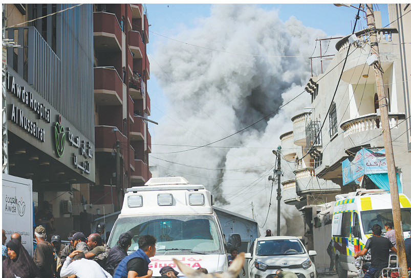
6月8日,在加沙地带中部努赛赖特难民营,以军袭击后浓烟滚滚。