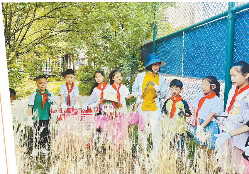
小麦生长季劳动教育