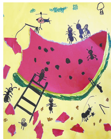
蚂蚁搬西瓜 开源路小学一(3)班 马梓宸 (指导老师:梅剑祯)