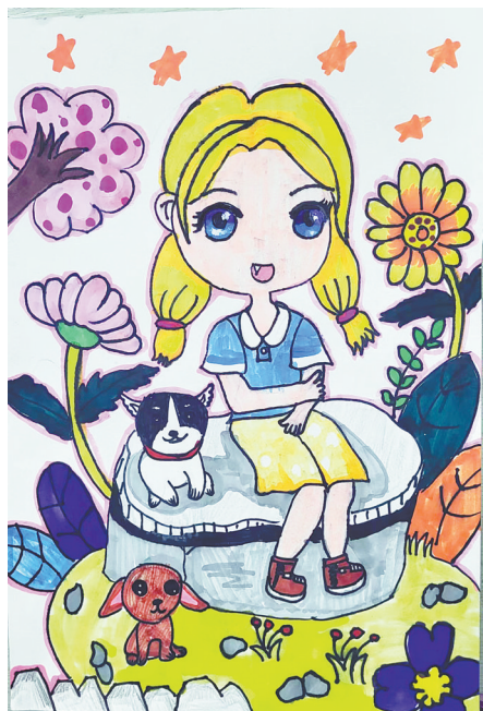
花园女孩 联盟路小学教育集团 三(5)班 胡雨晗

春季运动会结束后,表现优异的班级和运动健儿获颁奖状。“我们希望通过开展运动会,增强学生体质,丰富校园文化生活,培养团队精神和竞争意识,切实提高学生的心理和身体素质。”该校区校长彭现花说。(郝晓芳)