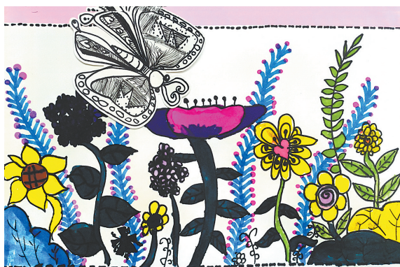
春暖花开 蝴蝶自来 光明路小学教育集团二(9)班 沈煦