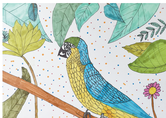
鹦鹉 胜利街小学教育集团四(7)班 狄子雯