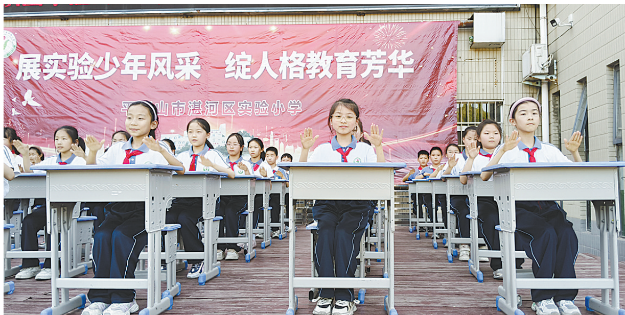
湛河区实验小学四(11)班学生表演课桌舞《上春山》

本报讯 4月23日,湛河区实验小学在校园内举办了校园文化艺术节,包括沐浴书香乐成长、我是经典传颂人、活力少年课桌舞、我的课堂我展示、人格少年乐游园、劳动技能展示会、综艺会演展风采等七大板块。