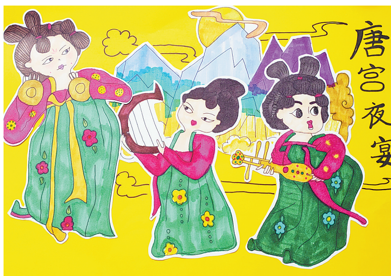
唐宫夜宴 四(2)班 史馨垚 (指导老师:张艳姣)

调皮的迎春花忙不迭地跑来凑热闹，她迫不及待地绽放枝头，拍着手笑道：“春天真的来了！”小燕子们穿着花衣裳从南方飞回来，她们追逐着天空中的风筝边嬉戏边说：“春天回来了，春天真美啊！”