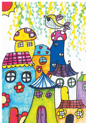
春归 二(3)班 闫嘉屹 (指导老师:刘闪闪)