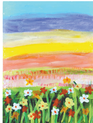
春暖花开 四(2)班 张梦好 (指导老师:刘闪闪)