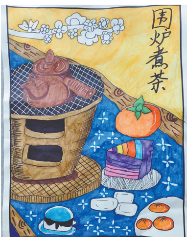
围炉煮茶 四(4)班 王艺涵 (指导老师:贾向月)