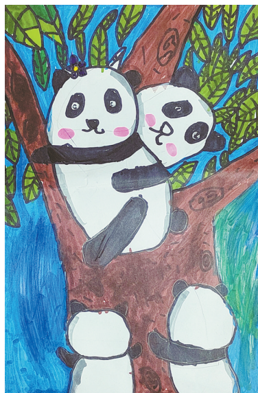
可可爱爱 福佑路小学二(4)班 李昭凝 (指导老师:杨超楠)