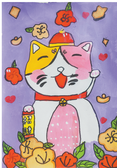
招财猫 公明路小学三(1)班 张语桐 (指导老师:关文菲)