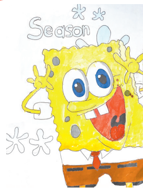
海绵宝宝 雷锋小学教育集团四(8)班 邵金泽