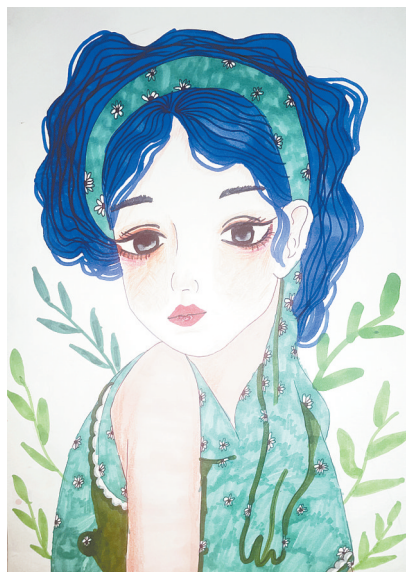
妈妈 雷锋小学教育集团四(8)班 赵梓妍 (指导老师:王锐军)