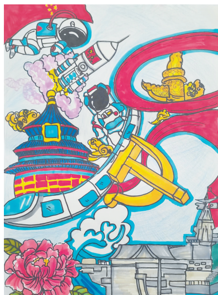
龙年畅想 乐福小学四(2)班 郭旭尧