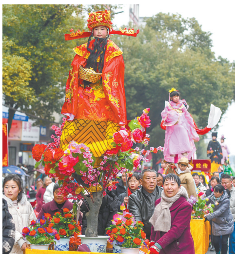
左图:2月8日,在江苏省兴化市昭阳街道八字桥文旅休闲街区,市民在观看舞狮表演(无人机照片)。右图:2月7日,参演人员在江西省樟树市临江镇进行民俗文化巡演活动。春节将至,各地举办丰富多彩的民俗展演活动,热热闹闹迎新春。