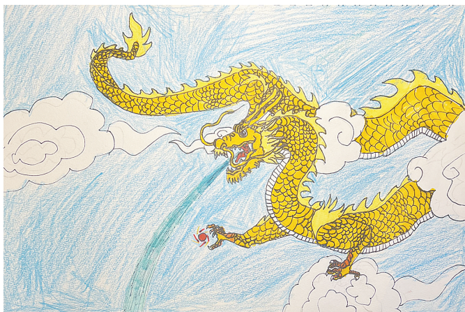
龙年大吉 沁园小学四(1)班 秦沐阳(指导老师:周素君)