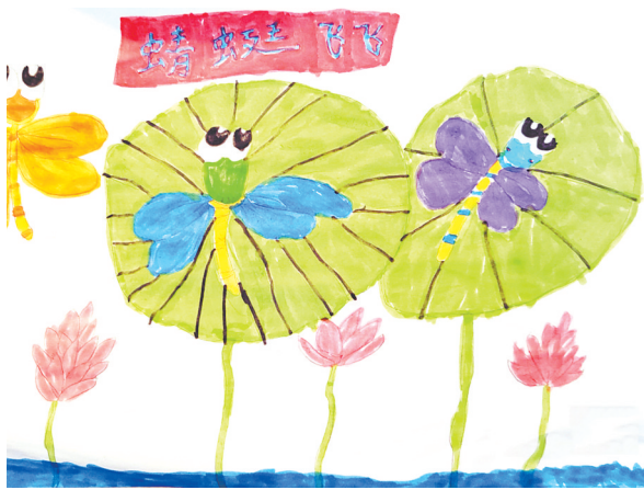
蜻蜓飞飞 五条路小学二(5)班 冯星月